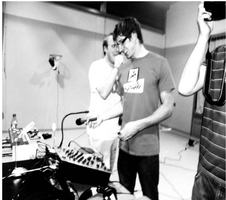
Un merci tout particulier aux DJS